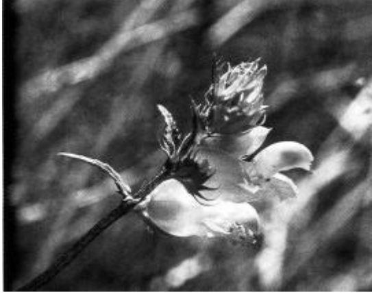
Abbildung 3: Rhinanthus glacialis . Dia-Nummer 8572; 18. 7. 1999. Aufnahme am Ort der Vegetationsaufnahme 99-180. Die bestimmungswichtigen Blütenmerkmale sind die stark aufwärts gewölbte Oberlippe mit den langen Zähnen und dem offenen Schlund.